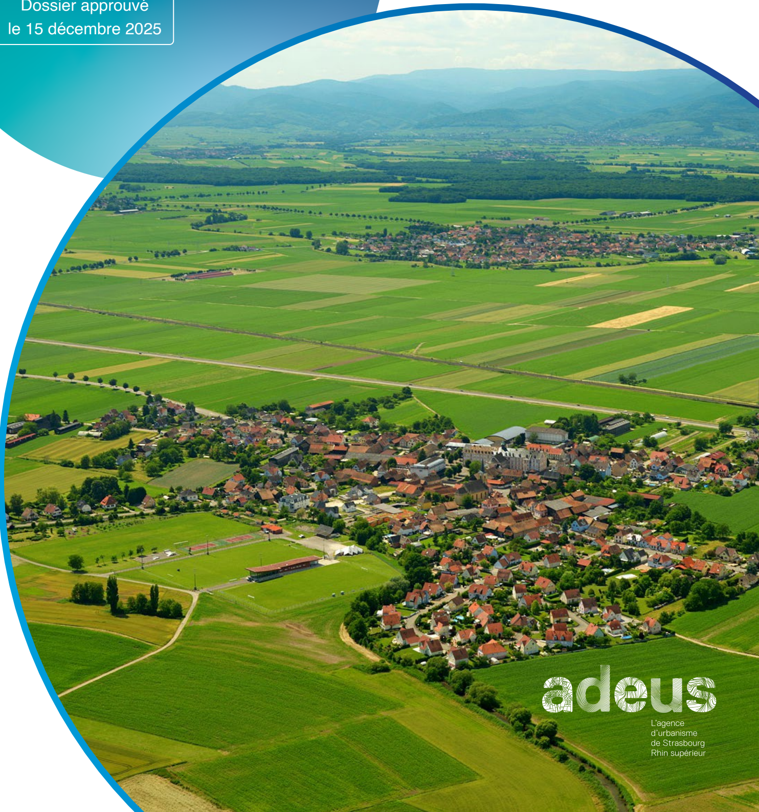
Schéma de cohérence territoriale de la région de Strasbourg